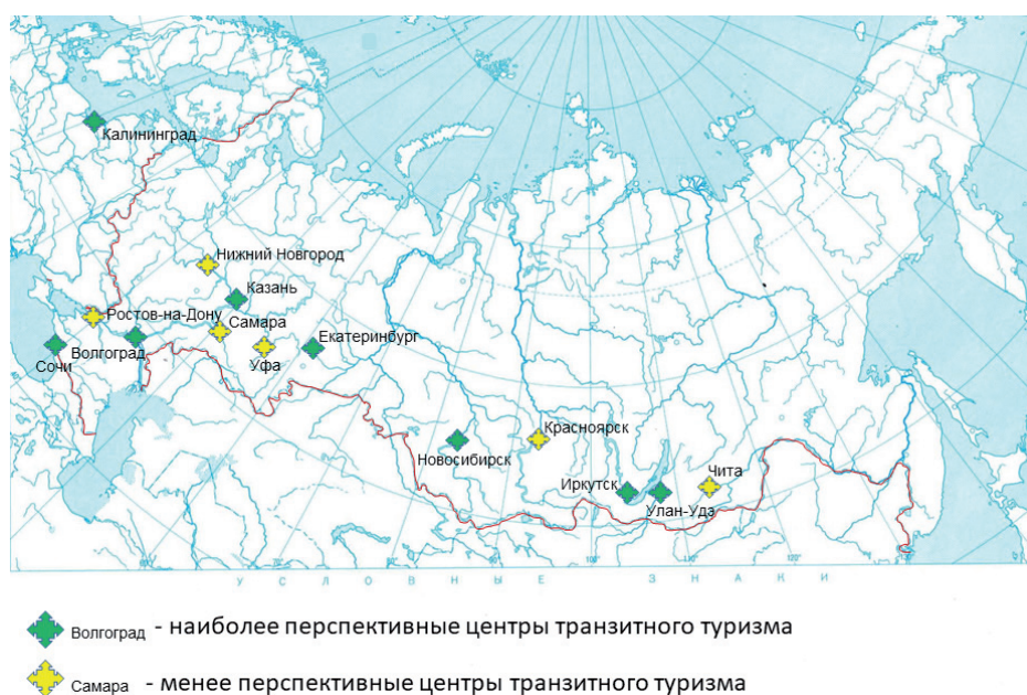
Рис. 2. Карта перспективных городов России для транзитного туризма

Следовательно, мы сделали вывод, что для развития транзитного туризма в России необходимо рассматривать города, которые, во-первых, могут предложить маршруты разной туристической направленности (этнографические, религиозные, исторические и т. д.), во-вторых, имеют крупные аэропорты, принимающие международные рейсы . На данный момент единственным городом, осуществляющим некоторые стыковочные рейсы в страны Восточной и Юго-Восточной Азии, является Новосибирск. Пересадки туристов иногда осуществляются во Владивостоке и Хабаровске. Однако в России есть и другие регионы, где возможно осуществление не просто стыковочных рейсов, но и организации интересных туристических программ. Нами была составлена карта перспективных городов для транзитного туризма (рис. 2).