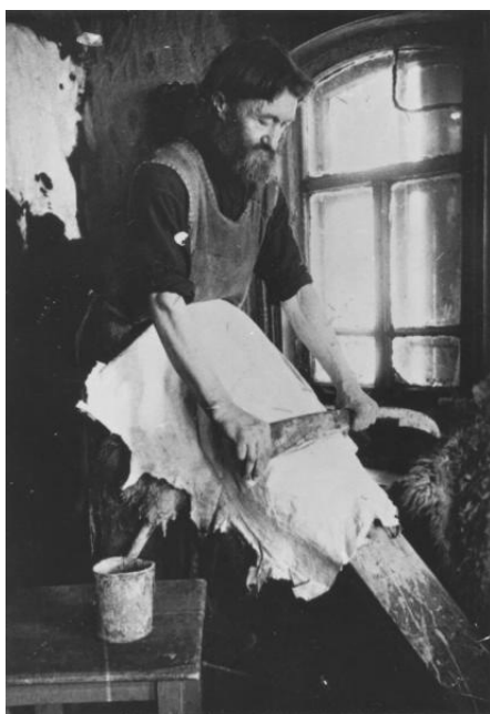
Рис. 7. С. Коршунов «Выделка овчины для теплых полушубков» [7]