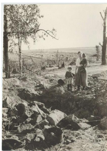
Рис. 2. О. Игнатович «Калининский фронт. Без крова» [4]

Обратим внимание и на то, что люди работали и помогали другим и фронту зачастую в условиях полнейшего отсутствия не только жилищных удобств в виде воды, света и еды, но и в условиях отсутствия дома и даже матраца для сна (рис. 2).