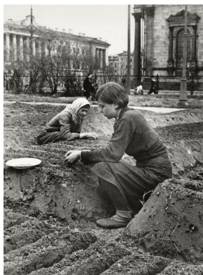
Рис. 1. В. Капустина «Огород у Исаакиевского собора» [6]

Ежедневные лишения народа проявлялись абсолютно во всех областях жизнедеятельности. В период Сталинградской битвы на вес золота была вода. При первой же бомбардировке города все коммуникации города были разрушены. Вспомним описанные ощущения немецкой девушки при взятии Берлина: «...Оглядевшись, не видит ли кто, повернула рукоятку крана. Оттуда потекла коричневая жижа, но уже через несколько секунд пошла кристально чистая вода... Город был все-таки жив...» [3]. Такую радость не могли испытать советские жители в период обстрела и блокады. На снимке В. Капустиной «Огород у Исаакиевского собора» прекрасно показана организованность и сила противостояния населения в период блокады Ленинграда (рис. 1).