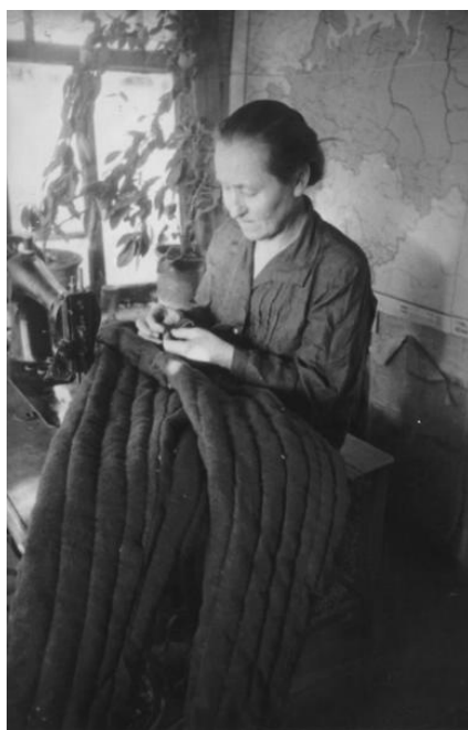
Рис. 8. С. Коршунов «Теплая одежда для фронта» [8]

Последнюю группу источников составляют фотодокументы, доказывающие высокие темпы восстановления разрушенных городов за счет неугасаемого энтузиазма оставшегося в живых населения. Подтверждает этот факт всеобщего участия блокадников в расчистке Литейного проспекта (см. рис. 9 на с. 35).