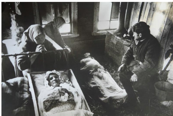
Рис. 4. Г. Санько «После ухода фашистов» [10]

Проявление чувств глубокой ненависти к нацистской Германии, которая безжалостно убивала всех на своем пути, не мешали человеку оставаться человеком. Могилы немецких солдат на территории Советского Союза не подвергались вандализму. Так же мирное население участвовало в процессе их захоронения не только с целью торможения распространения антисанитарии, но из идей гуманности.