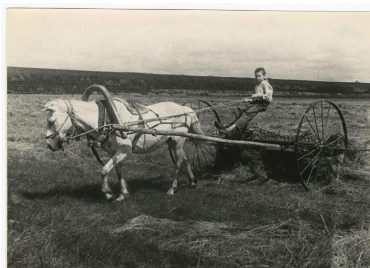
Рис. 6. С. Васин «Пионер Ваня Подкатнов работает в поле» [2]

Наиболее яркое представление лишений советских граждан дают фотодокументы, подтверждающие факт неотъемлемого участия тыла в прокладывании пути к победе. Вплоть до 1945 г. не переставали работать дети, женщины и старики (рис. 6, 7, 8 см. на с. 34). Более того, они продолжали выполнять свой патриотический долг даже в моменты захвата территорий врагом.