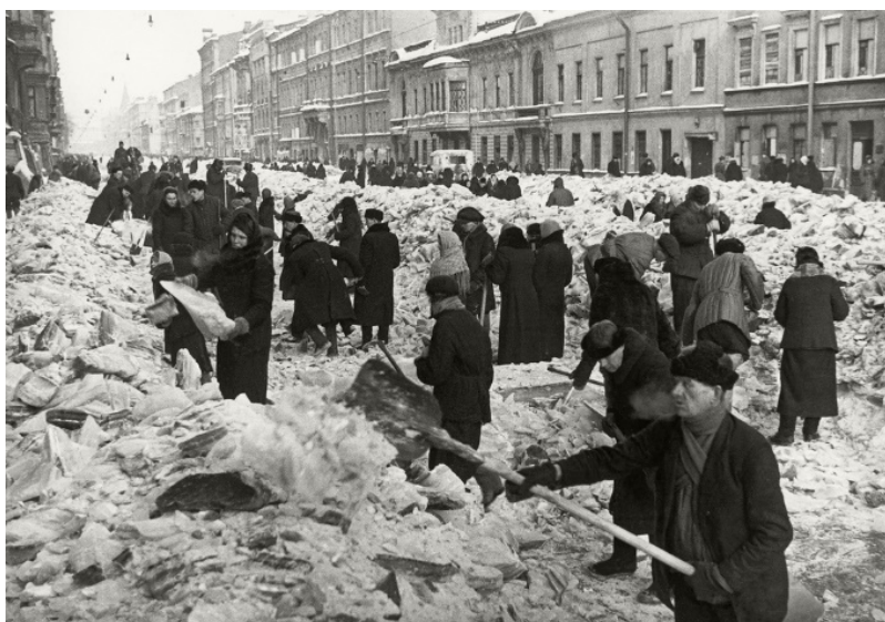
Рис. 9. В. Тарасевич «Расчистка проспекта» [12]

Таким образом, можно сделать следующие выводы. Общедоступная фотодокументальная база является репрезентативным источником хранения информации о событиях и фактах общественной жизни периода Великой Отечественной войны. На основе визуализации ежедневных бытовых лишений жителей советского союза на период 1941–1945 гг. можно возродить процесс становления патриотического отношения к героизму наших ближайших предков.