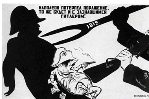
Рис. 5. Наполеон потерпел поражение. То же будет и с зазнавшимся Гитлером

На протяжении всей войны художники отражали в плакатах значимые события и исторических личностей, которые прославились своими поступками в тяжелые времена для нашей страны. В плакате Кукрыниксов 1941 г. «Бьемся мы здорово, колем отчаянно – внуки Суворова, дети Чапаева» (см. рис. 6 на с. 19) [Там же] прослеживается преемственность поколений в сражении с врагом. На переднем плане пред нами предстают настроенные на борьбу солдаты советской армии, а за ними полководец А.В. Суворов и комдив Красной Армии в период Гражданской войны В.И. Чапаев, которые указывают на стойкость наших солдат, а также настраивают людей вставать на защиту своей родины.