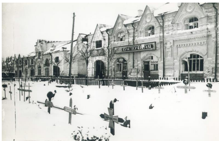
Рис. 3. И. Шагин «Кладбище немецких солдат в центре города» [13]

Вторая группа фотографий повествует о проявлении высоких моральных качеств советского человека даже в такие страшные времена, где, казалось бы, следует думать только о себе и своих близких. Сравним фотографии «Кладбище немецких солдат в центре города» (рис. 3) и «После ухода фашистов» (рис. 4).