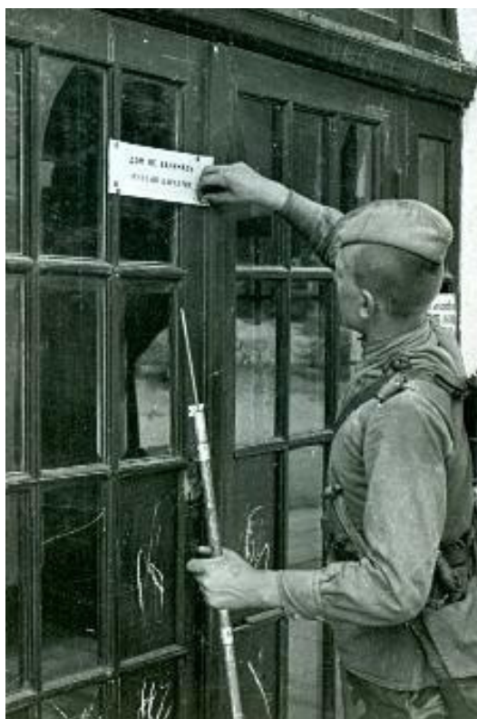
Рис. 5. И. Шагин «Минный карантин» [14]

Наиболее яркое представление лишений советских граждан дают фотодокументы, подтверждающие факт неотъемлемого участия тыла в прокладывании пути к победе. Вплоть до 1945 г. не переставали работать дети, женщины и старики (рис. 6, 7, 8 см. на с. 34). Более того, они продолжали выполнять свой патриотический долг даже в моменты захвата территорий врагом.