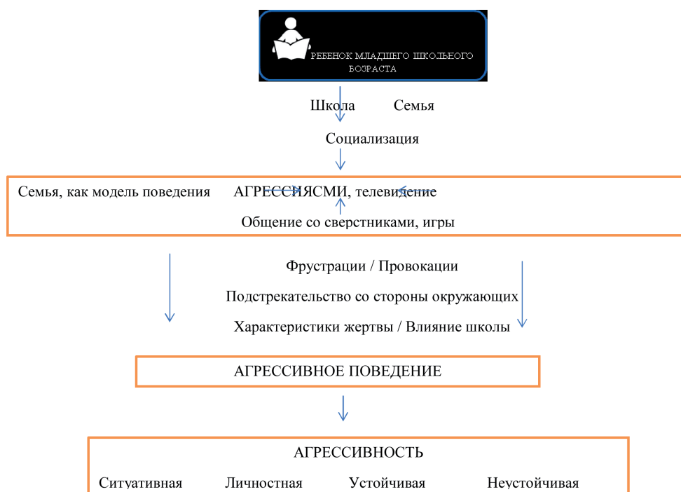
Рис. 1. Схема возникновения и развития агрессивного поведения у детей младшего школьного возраста