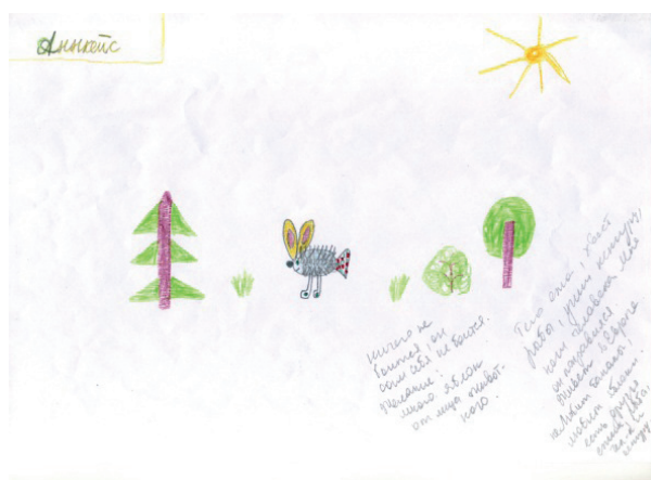
Рис. 2. Рисунок с выявленной агрессией защитного механизма

В исследовании выявлено расхождение полученных результатов по экспертной оценке педагога с анализом рисунка одного из испытуемых (см. рис. 2). Педагог охарактеризовал ученика, выполнившего данный рисунок, как не имеющего проявлений агрессивности в поведении, но на рисунке можно увидеть признаки агрессии защитного свойства. При низкой самооценке у испытуемого можно выделить высокую степень ощущения небезопасности окружающего мира, готовности к агрессии. Наличие второстепенных элементов на рисунке (деревья, трава, кустарник, солнце) и расположение несуществующего животного между ними еще раз подтверждает агрессию защитного характера. Можно предположить, что оценка педагога обусловлена тем, что агрессивность ребенка носит ситуативный характер и проявляется редко, в случаях самозащиты в общении со сверстниками или в семье. В учебной среде признаки агрессивного поведения у испытуемого, по мнению педагога, не проявляются.