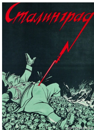
Рис. 12. Сталинград

Репрезентативно освящена одна из самых кровопролитных и значимых битв Великой Отечественной войны – Сталинградская битва. Так, на плакате В. Дени «Сталинград» (см. рис. 12), созданном в 1942 г. [Там же], немец, поврежденный штыком, исходящим из буквы «д», лежит на множестве трупов, что давало советским людям стимул разгромить немецких захватчиков под Сталинградом.