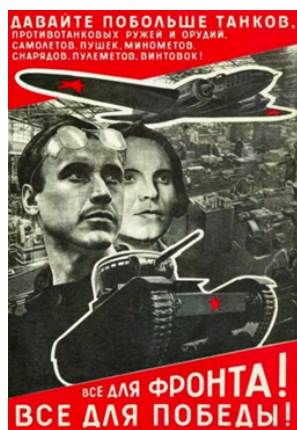
Рис. 11. Все для фронта! Всё для победы!

Отметим, политический, агитационный плакат фиксировал призыв не только к боевой, но и трудовой защите Родины. Например, плакат художника Лазаря Лисицкого «Все для фронта! Всё для победы!» [3] (см. рис. 11) обращался к работникам тыла с посылом – именно от них во многом зависит успех и победа советских войск. В дальнейшем эта фраза получила в стране широкое распространение как призыв к действию и усиленной работе на производстве.