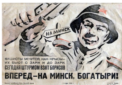
Рис. 18. Вперед – на Минск, богатыри!

Безусловно, массовая политическая графика (а плакаты являлись ее приоритетной составляющей) успешно реализовывала наглядным способом идеологическое направление в деятельности партийно-государственных структур. Важно отметить другое, художникам в яркой цветовой форме, используя понятные большинству образы, а также сатирические и аллегорические приемы, удалось сформировать важный пласт источников по истории Великой Отечественной войны в целом и её отдельных эпизодов, в частности. Мы не ставили задачу в полном объеме на базе визуальных художественных источников рассмотреть одно из самых ключевых событий для России XX в., длившееся 1418 дней. Однако анализ более пятидесяти визуальных художественных источников военного периода позволил сделать несколько выводов.