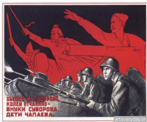
Рис. 6. Бьемся мы здорово, колем отчаянно – внуки Суворова, дети Чапаева