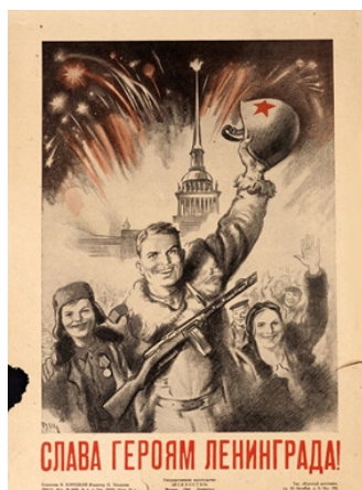
Рис. 17. Слава героям Ленинграда!

В.Б. Корецкий плакатно визуализировал окончательное освобождение Ленинграда в январе 1944 г. [3] (см. рис. 17). 1 июня 1944 г. в газете «На штурм врага» был опубликован рисунок В. Хеса [Там же] (см. рис. 18 на с. 24), отражающий подготовку к операции «Багратион» по освобождению Белорусской ССР, которая начнется 23 июня.