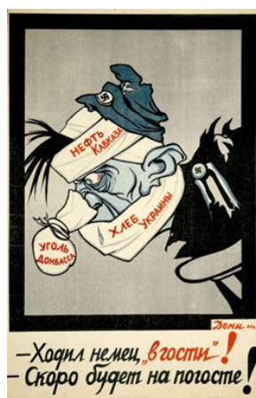
Рис. 16. Ходил немец «в гости»! Скоро будет на погосте!

В.Б. Корецкий плакатно визуализировал окончательное освобождение Ленинграда в январе 1944 г. [3] (см. рис. 17). 1 июня 1944 г. в газете «На штурм врага» был опубликован рисунок В. Хеса [Там же] (см. рис. 18 на с. 24), отражающий подготовку к операции «Багратион» по освобождению Белорусской ССР, которая начнется 23 июня.