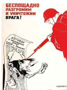
Рис. 1. Беспощадно разгромим и уничтожим врага!

22 июня 1941 г. в день начала Великой Отечественной войны художники Кукрыниксы создали плакат «Беспощадно разгромим и уничтожим врага!» (см. рис. 1), который уже через 2 дня стал печататься многотысячными тиражами издательством «Правда» [3]. В данном плакате мы можем увидеть советского солдата, уничтожающего Гитлера. Лицо солдата серьезно и целенаправленно, оно отображает настрой и стремление всего государства разгромить врага.