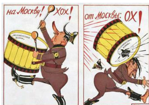
Рис. 10. На Москву! Хох! От Москвы: Ох!

Подчеркнем, плакаты были написаны и опубликованы в 1942 г., т. е. в период, когда войска Красной Армии одержали первую значительную победу под Москвой, сорвав план противника молниеносной войны. Московской битве посвящен значительный пласт плакатной и сатирической живописи [3]: «Защитим родную Москву!», «Отстоим Москву!» (Б.А. Мухин, Н.Н. Жуков и В.С. Климашин); «Наши силы неисчислимы» (В.Б. Корецкого); «Девушки! На защиту Москвы!» (Е.А. Афанасьевой); «Народ, армия, Сталин – спасли тебя, Москва!» (В.С. Иванова) и др. Одной из наиболее ярко отражающей итог Московского сражения стала карикатура В. Дени (Денисова) «На Москву! Хох! От Москвы: Ох!» (см. рис. 10).