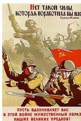
Рис. 8. Нет такой силы, которая поработила бы нас