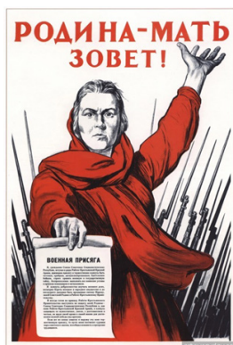
Рис. 2. Родина-мать зовёт!

Так же летом 1941 г. Ираклием Гоидзе был создан один из самых узнаваемых и значимых плакатов Великой Отечественной войны – плакат «Родина-мать зовёт!» [3] (см. рис. 2). Сейчас, когда мы смотрим на этот плакат, непроизвольно вспоминаем те страшные дни в нашей истории, подвиги, которые совершали советские солдаты. Образ женщины, зовущей на защиту своих «сыночек», олицетворяет родину, которую необходимо защитить и не допустить её захвата фашистскими войсками. Плакат несет в себе пропагандистскую функцию, призывает жителей страны вставать на защиту своей родины.