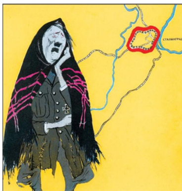
Рис. 14. Старинная русская песня «Потеряла я колечко...» (а в колечке 22 дивизии)

Еще один плакат Кукрыниксов «Старинная русская песня “Потеряла я колечко...” (а в колечке 22 дивизии)» [3] (см. рис. 14), который получил широкое распространение, посвящен разгрому врага под Сталинградом. Именно окончание Сталинградской битвы положило начало коренному перелому в Великой Отечественной войне. Плакат в сатирической форме визуализирует военное время, однозначно дает понять, что план Гитлера не удался и фашисты под Сталинградом были разгромлены. Эта работа Кукрыниксов побуждала продолжать сражаться и веру в то, что уже в скором времени удастся изгнать врага из нашей страны.