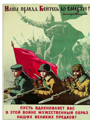
Рис. 9. Наша правда. Бейтесь до смерти!

Подчеркнем, плакаты были написаны и опубликованы в 1942 г., т. е. в период, когда войска Красной Армии одержали первую значительную победу под Москвой, сорвав план противника молниеносной войны. Московской битве посвящен значительный пласт плакатной и сатирической живописи [3]: «Защитим родную Москву!», «Отстоим Москву!» (Б.А. Мухин, Н.Н. Жуков и В.С. Климашин); «Наши силы неисчислимы» (В.Б. Корецкого); «Девушки! На защиту Москвы!» (Е.А. Афанасьевой); «Народ, армия, Сталин – спасли тебя, Москва!» (В.С. Иванова) и др. Одной из наиболее ярко отражающей итог Московского сражения стала карикатура В. Дени (Денисова) «На Москву! Хох! От Москвы: Ох!» (см. рис. 10).