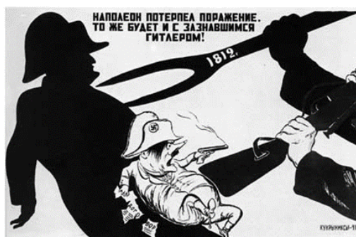
Рис. 5. Наполеон потерпел поражение. То же будет и с зазнавшимся Гитлером

На протяжении всей войны художники отражали в плакатах значимые события и исторических личностей, которые прославились своими поступками в тяжелые времена для нашей страны. В плакате Кукрыниксов 1941 г. «Бьемся мы здорово, колем отчаянно – внуки Суворова, дети Чапаева» (см. рис. 6 на с. 19) [Там же] прослеживается преемственность поколений в сражении с врагом. На переднем плане пред нами предстают настроенные на борьбу солдаты советской армии, а за ними полководец А.В. Суворов и комдив Красной Армии в период Гражданской войны В.И. Чапаев, которые указывают на стойкость наших солдат, а также настраивают людей вставать на защиту своей родины.