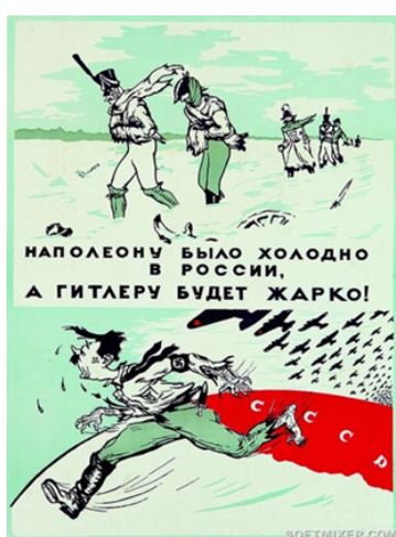
Рис. 4. Наполеону было холодно в России, а Гитлеру будет жарко!

с Россией. Например, плакат, выполненный в жанре карикатуры, художника Эмманула Ландреса «Наполеону было холодно в России, а Гитлеру будет жарко!» (см. рис. 4), а также работа коллектива Кукрыниксов «Наполеон потерпел поражение. То же будет и с зазнавшимся Гитлером» (см. рис. 5). Оба плаката были созданы в 1941 г. [3], когда противник значительно продвинулся вглубь страны. Таким образом, важно было поднять моральный дух советских граждан. Для этого художники обратились к героическому прошлому отечественной истории – важнейшему историческому «сюжету» почти 130-летней давности. Посредством визуализации образа Наполеона советские граждане вспоминали победу над французами в Отечественной войне 1812 г., что в определенной степени вселяло в людей веру и надежду о том, что и немецкий враг будет уничтожен.