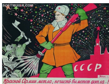
Рис. 15. Красной Армии метла, нечисть выметет дотла!