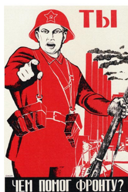
Рис. 3. Ты чем помог фронту?

Это плакат схож с советским плакатом Дмитрия Моора «А ты записался добровольцем?», который был создан в период гражданской войны. Во время Великой Отечественной войны на этом плакате изменяли текст, подстраивая под реалии: «Ты чем помог фронту?» [Там же] (см. рис. 3). В те времена плакаты были наглядной визуализацией происходящих событий. На сегодняшний день некоторые плакаты военного времени до сих пор актуальны. В современном обществе интернет и средства массовой информации в значительной степени визуализируют современность. Например, плакаты «Родина-мать зовёт!» и «А ты записался добровольцем?» активно используются в глобальной компьютерной сети, их текст изменяют под конкретные ситуации, но функция пропаганды остаётся неизменной.