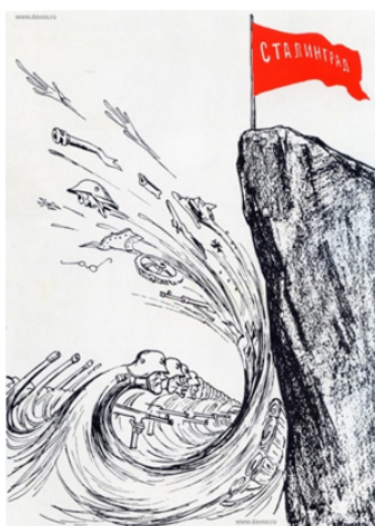
Рис. 13. Есть на Волге утёс...

Еще один плакат Кукрыниксов «Старинная русская песня “Потеряла я колечко...” (а в колечке 22 дивизии)» [3] (см. рис. 14), который получил широкое распространение, посвящен разгрому врага под Сталинградом. Именно окончание Сталинградской битвы положило начало коренному перелому в Великой Отечественной войне. Плакат в сатирической форме визуализирует военное время, однозначно дает понять, что план Гитлера не удался и фашисты под Сталинградом были разгромлены. Эта работа Кукрыниксов побуждала продолжать сражаться и веру в то, что уже в скором времени удастся изгнать врага из нашей страны.