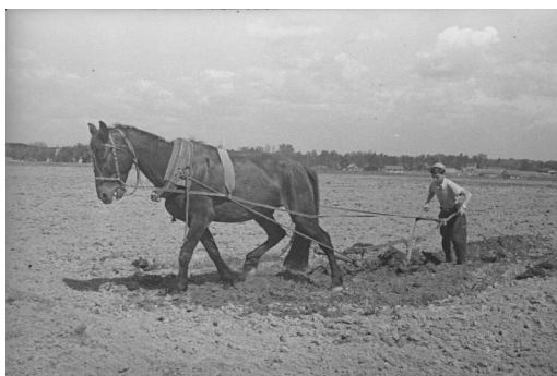
Рис. 11. С. Васин. Пахота [3]

Те дети, которых на войну не взяли, дни и ночи работали с женщинами и стариками для обеспечения фронта всем необходимым: продуктами и боеприпасами (см. рис. 11). Мирное население находило время и для духовной поддержки солдат (см. рис. 12, 13 на с. 21). Фронтовики, в свою очередь, не забывали оповещать родных о своем здоровье и положении дел на поле боя (см. рис. 14 на с. 21).