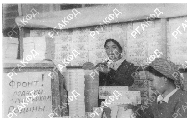
Рис. 12. Упаковка подарков для фронтовиков на Алма-Атинской табачной фабрике [21]