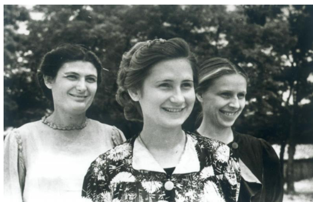
Рис. 15. Студентки-доноры 2-го Медицинского института [22]

В годы войны были созданы пункты переливания крови, которые присутствовали повсеместно в тылу и на фронте. На войне донорами стали 5,5 млн человек, из которых 90% составляли женщины [9] (см. рис. 15).