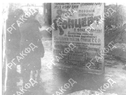
Рис. 7. Жители города возле афиши концерта, средства от проведения которого будут перечислены в фонд обороны страны [6]