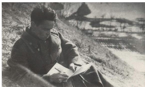
Рис. 14. Пархоменко А. Солдат на привале [14]

В годы войны были созданы пункты переливания крови, которые присутствовали повсеместно в тылу и на фронте. На войне донорами стали 5,5 млн человек, из которых 90% составляли женщины [9] (см. рис. 15).