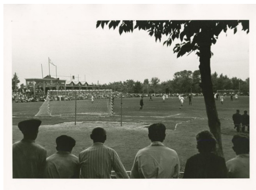
Рис. 10. Е. Умнов. Футбольный матч в Сталинграде [20]

Те дети, которых на войну не взяли, дни и ночи работали с женщинами и стариками для обеспечения фронта всем необходимым: продуктами и боеприпасами (см. рис. 11). Мирное население находило время и для духовной поддержки солдат (см. рис. 12, 13 на с. 21). Фронтовики, в свою очередь, не забывали оповещать родных о своем здоровье и положении дел на поле боя (см. рис. 14 на с. 21).