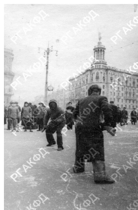
Рис. 8. Соревнования по штыковому бою на первенство на Пушкинской площади г. Москвы [18]