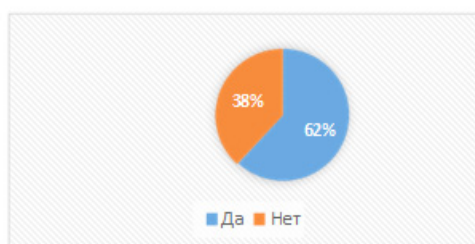
Рис. 2. Выбрали ли Вы свою будущую профессию?

В статусе «неопределенной» профессиональной идентичности находятся 25% испытуемых. Это значит, что учащиеся еще не сделали выбор жизненного пути, у них нет прочных профессиональных целей и планов. Возможно, эти старшеклассники пока не задумываются о своей будущей профессии. Статус «навязанная профессиональная идентичность» и «сформированная профессиональная идентичность» у учащихся выявлен не был. Можно сделать вывод, что старшеклассники, в целом, осознают проблему выбора будущей профессии. Имеющиеся сформированные представления о своем профессиональном будущем не навязаны старшеклассникам извне (например, родителями), они сами определяют свое профессиональное будущее. Результаты второго исследования были следующие (рис. 2).