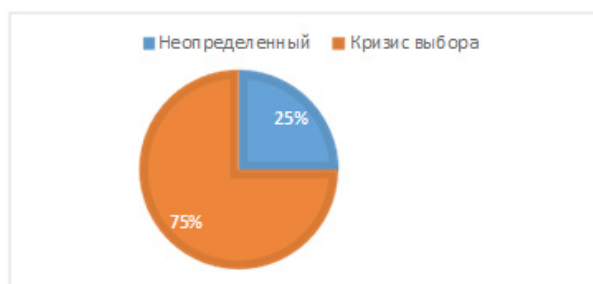
Рис. 1. Статусы профессиональной идентичности

75% испытуемых находятся в статусе «мораторий», т.е. кризис выбора профессиональной идентичности. Это говорит о том, что старшеклассники осознают важность проблемы выбора профессии, находятся в состоянии поиска альтернативных вариантов профессионального развития, но наиболее подходящий вариант еще не выбрали.