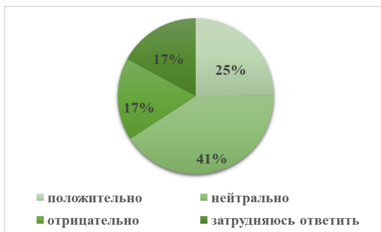
Рис. 3. Отношение учащихся школ г. Ельца к возможности заимствования методов патриотического воспитания стран Азии

Среди 61% опрошенных, знакомых с методами патриотического воспитания стран Азии, на вопрос о заимствовании данных форм воспитания 25% ответили, что к данному заимствованию они бы отнеслись положительно, 41% – нейтрально, 17% – отрицательно, воздержались также 17%. (см. рис. 3).