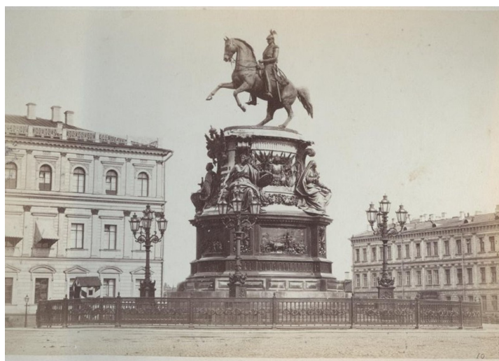
Рис. 3. Лоренс А. Памятник Николаю I [9]