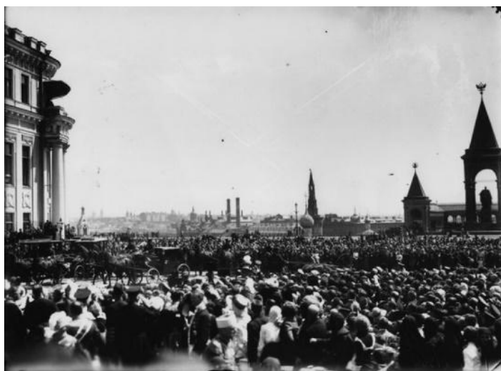
Рис. 11. Празднование «Романовских дней».

Проезд кортежа в Кремле на фоне Москвы. Дата съемки: 24 мая 1913 г. [15]