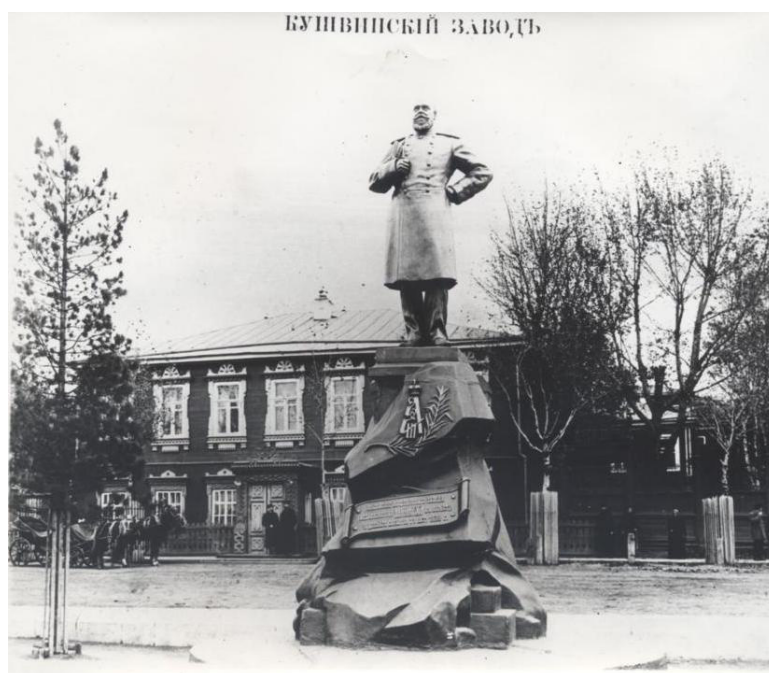
Рис. 2. Памятник Александру III [13]

Фотография неизвестного автора «Памятник Александру III» (рис. 2), созданная в 1900-е годы визуализирует образ императора в представлениях российских промышленных рабочих. Надпись на пьедестале гласит: «Население Кушвинского завода незабвенному монарху в память чудесного события 17 октября 1888 года». Дата вошла в историю событием крушения императорского поезда между станциями Тарановка и Борки Курско-Харьковско-Азовской железной дороги. Авария принесла трагическую смерть немалому количеству человек [7].