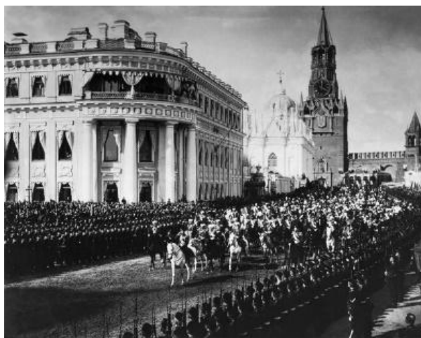
Рис. 9. Булла К. (фотоателье). Торжественный въезд императора Николая II на территорию Кремля. 1896 г. [3]