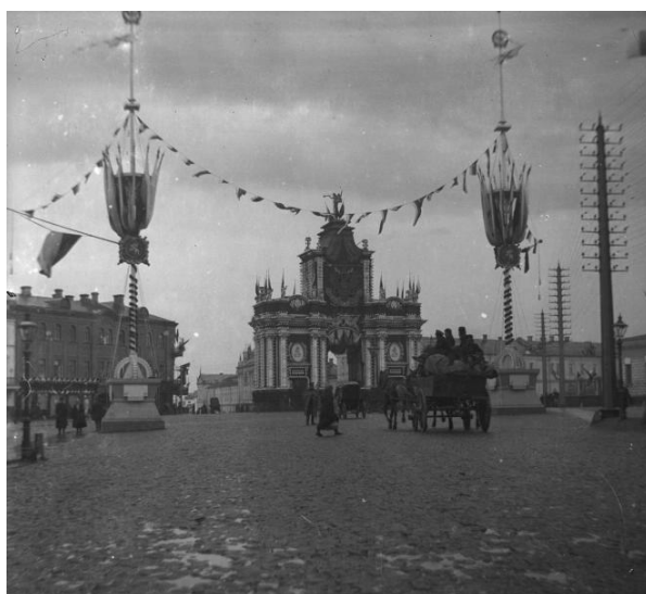
Рис. 10. У Красных ворот в дни коронации Николая II. 1896 г. [17]