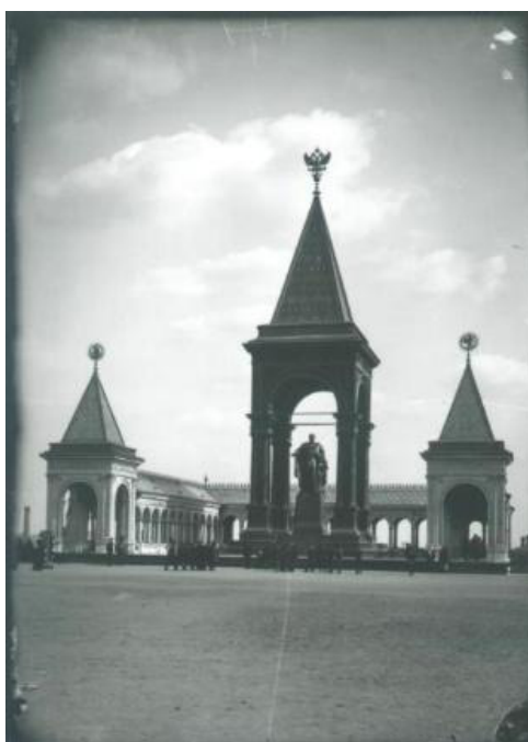
Рис. 1. Павлов П. Памятник Александру II в Кремле [12]

Так, уже 8 марта 1881 г., через неделю после убийства Александра II, московский городской голова Сергей Третьяков предложил установить в Кремле монумент в память о погибшем самодержце (рис. 1). Его инициатива была поддержана гласными городской думы и правящим императором Александром III [16]. Монумент заложили в 1893 г. в юго-восточной части Кремля над склоном холма, обращенным к Москве-реке. В его создании принимали участие архитектор Н.В. Султанов, скульптор А.М. Опекушин и художник П.В. Жуковский. Строительство велось в течение пяти лет на всенародные пожертвования [1].