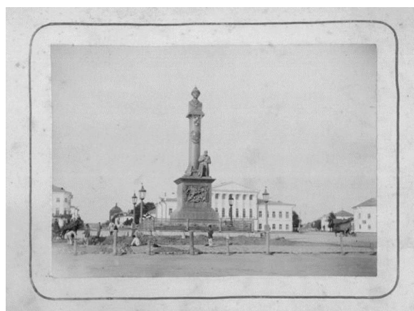
Рис. 5. Кордыш И. Памятник царю Михаилу Федоровичу и Ивану Сусанину [9].