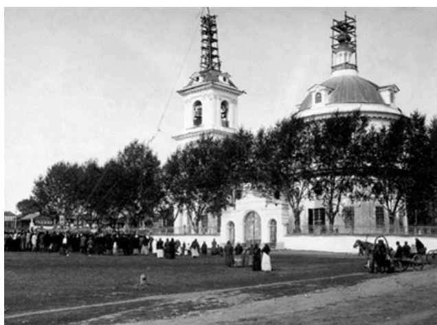
Рис. 7. Подъем креста на Спасо-Преображенскую церковь [14]

Помимо сооружения и открытия памятников, храмов, церквей, домов культуры, музеев, ярмарок, сельскохозяйственных выставок, университетов и школ, общенациональными событиями (имеющими высокую идеологическую значимость) являлись: коронация императора на престол (см. рис. 9, 10 на с. 46), празднование «Романовских дней» (см. рис. 11 на с. 47).