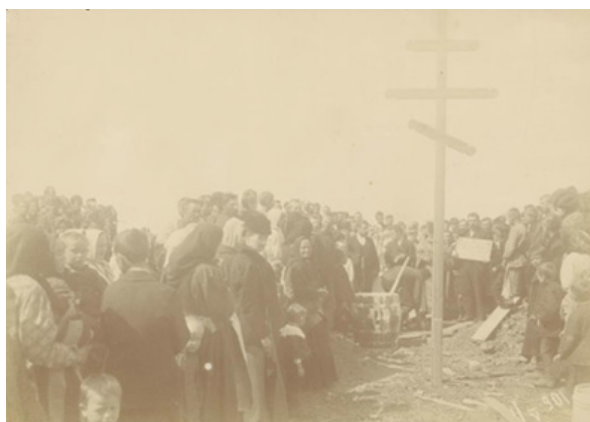
Рис. 8. Закладка строительства храма. 1901 г. [4]