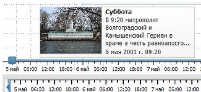
Рис. 2. Первая запись «Судового журнала...»

Приведем пример работы с одним фрагментом этого художественного произведения. «Судовой журнал...» начинается с отправной точки путешествия – поселка Пятиморск. В субботу, 5 мая 2001 г., митрополитом Волгоградским и Камышинским Германом был отслужен молебен «Путешествующим по водам», который завершился крестным ходом и концертом воскресной школы. Для отображения данного события в «ОС3. Хронолайнер» нам нужны фотографии, фрагменты географических карт (с изображением населенных пунктов) и текст произведения. Чтобы на ленте времени появилась первая точка путешествия – поселок Пятиморск – мы использовали фотографию самой плавучей церкви (дабы показать учащимся, как выглядит такое судно), уточнили в заголовке день недели и дату, кратко перечислили произошедшие за день события. Соответственно, так будет выглядеть первая запись «Судового журнала...» в программе «ОС3. Хронолайнер» (см. рис. 2):