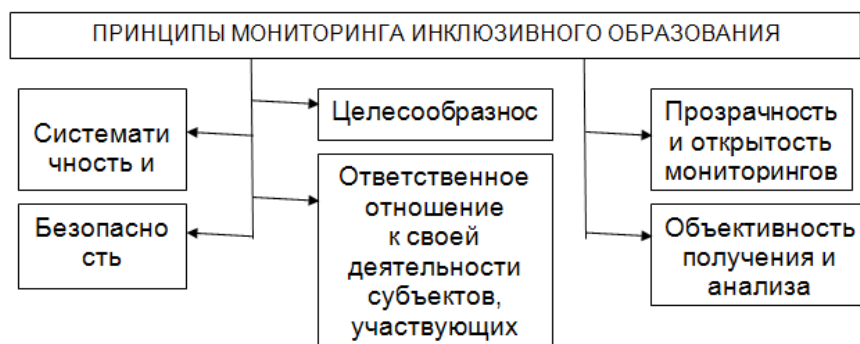
Рис. 1. Принципы мониторинга ИО

Мониторинг ИО образования должен проводиться на основе принципов отображенных на рис. 1.