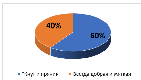
Рис. 3. На Ваш взгляд, в ходе воспитания ребёнка матери следует ...?

Анализ результатов: 60% (12 девушек) считают, что воспитание должно быть выстроено по принципу «кнута и пряника» – необходимо комбинировать поддержку и поощрение ребёнка с наказанием при необходимости; остальные 40% (8 девушек) считают, что мама должна быть: мягкой, доброй, готовой всегда прийти на помощь.