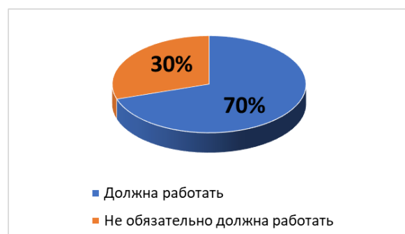
Рис. 4. Как матери должны совмещать свою трудовую деятельность и воспитание ребёнка?

Анализ результатов: 60% (12 девушек) считают, что воспитание должно быть выстроено по принципу «кнута и пряника» – необходимо комбинировать поддержку и поощрение ребёнка с наказанием при необходимости; остальные 40% (8 девушек) считают, что мама должна быть: мягкой, доброй, готовой всегда прийти на помощь.