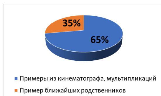
Рис. 5. Какой образ, который Вам кажется воплощением идеала матери (в кино, рекламе, среди реальных людей, исторических личностей и т. д.), Вы можете вспомнить?

Анализ результатов: 70% (14 девушек) считают, что мама обязательно должна работать по причине того, что в наших условиях жизнь на одну заработную плату супруга (партнёра) невозможна; остальные 30% (6 девушек) отдают предпочтение мнению, что женщине необязательно работать, если супруг (партнёр) полностью обеспечивает семью.