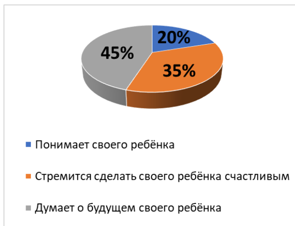
Рис. 6. На Ваш взгляд, хорошая мать та, которая ...?

Анализ показал, что 65% (13 девушек) описывали идеальный образ матери, взятый из кинематографа и мультипликаций. В качестве примера опрашиваемые приводили мультфильм «Три кота», художественный фильм «Птичий короб» с Сандрой Баллок и др. 35% (7 девушек), отвечая на данный вопрос, ссылались на образы своих ближайших родственников, это были бабушки и мамы.