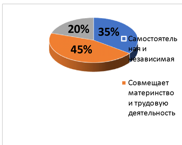
Рис. 7. По Вашему мнению, современная мать, прежде всего ...?

Анализ показал, что 20% (4 девушки) сказали, что хорошая мать всегда понимает своего ребёнка; 35% (7 девушек) сказали, что мать всегда должна стремиться сделать своё дитя счастливым, а 45% (8 девушек) сказали, что такой матери следует думать о будущем своего ребёнка.