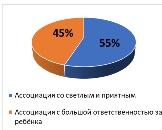
Рис. 2. Материнство у Вас ассоциируется прежде всего с ...?

При анализе данных, полученных при проведении опроса, было выявлено, что 80% (16 девушек) считают, что мать должна быть доброй; 5% (1 девушка) считает, что терпеливой и 15% (3 девушки) – отзывчивой.