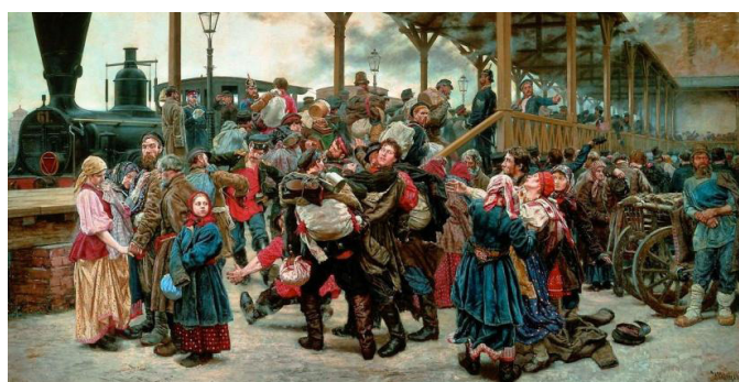
Рис. 5. К.А. Савицкий «На войну» (1888, Государственный Русский музей)

Проводы солдат на русско-турецкую войну изобразил и художник К.А. Савицкий (1844–1905) на картине «На войну» (1888) (см. рис. 5). На полотне изображены будущие солдаты в сопровождении родных на железнодорожной станции. Настроение у всех одно – понимание всех ужасов войны. Одни плачут, другие прощаются молча. Солдаты знают: скорее всего, многим не суждено вернуться с войны.