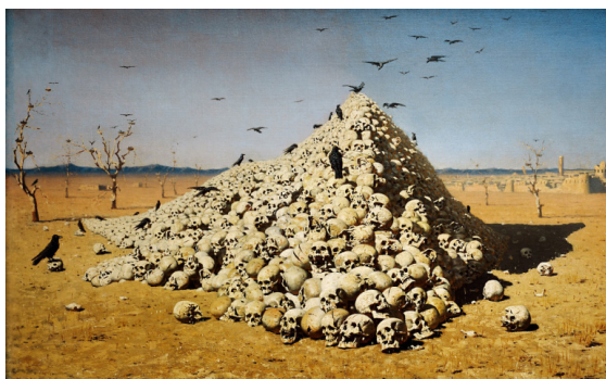
Рис. 1. В.В. Верещагин «Апофеоз войны» (1871, Государственная Третьяковская галерея)