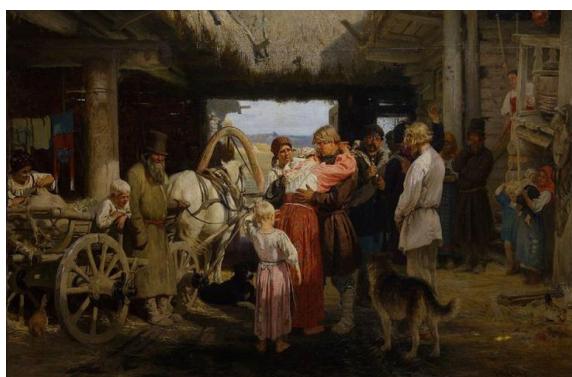
Рис. 3. И.Е. Репин «Проводы новобранца» (1879, Государственный Русский музей)

И.Е. Репин тщательно готовился к написанию своего художественного произведения. Он писал картину в течение 1877–1879 гг. в Москве и в летнее время в Абрамцеве – расположенной под Москвой усадьбе известного мецената Саввы Мамонтова, которая стала местом сбора крупнейших художников и музыкантов России.