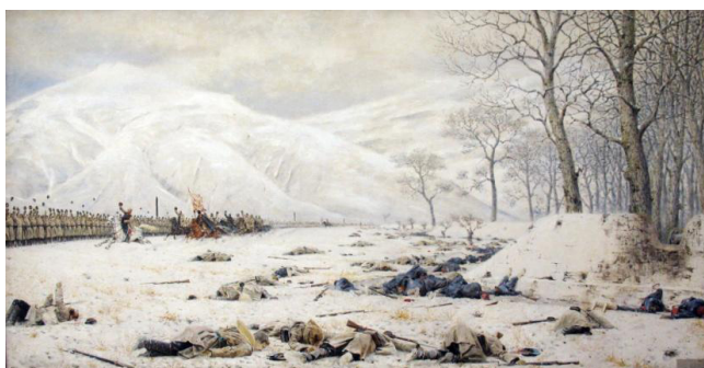
Рис. 2. В.В. Верещагин «Шипка-Шейново» (1878–79, Государственная Третьяковская галерея)

Действительно, В.В. Верещагин, будучи участником русско-турецкой войны, преодолел сложный путь через Балканские горы вместе с отрядом генерала М.Д. Скобелева. Он также участвовал в сражении при Шейново. Тогда русские войска окружили и взяли в плен 30-тысячную турецкую армию Весель-паши [15]. По сведениям известного отечественного театрального критика и литератора В.И. Немировича-Данченко художник в этой войне «не только рисовал – он собирал и свозил с полей целые груды пропитанного кровью тряпья, обломки оружия, мундиры турецких солдат» [7], т. е. все, что потом ему понадобится для написания картины.