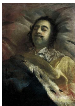
Рис. 1. И. Никитин. «Петр I на смертном ложе». 1725 г. [2]

Важно упомянуть про живопись, которая отражает в себе события, связанные с приходом Петра I к власти. Здесь необходимо рассмотреть гравюру Василия Верещагина «Цари Иоанн и Пётр Алексеевичи. Правительница Софья Алексеевна» (см. рис. 2), датированную XIX в. и в сравнении с ней привести картину французского живописца Карла Штейбена «Пётр Великий, спасаемый матерью от ярости стрельцов» (см. рис. 3). Данные живописные изображения олицетворяют обстоятельства, в которых юный наследник, растерянный от происходящей жестокой борьбы за власть, но не теряющий самообладания и уверенности, готов стать тем сильным правителем, который преобразит Россию и придаст ей статус великой державы [1].