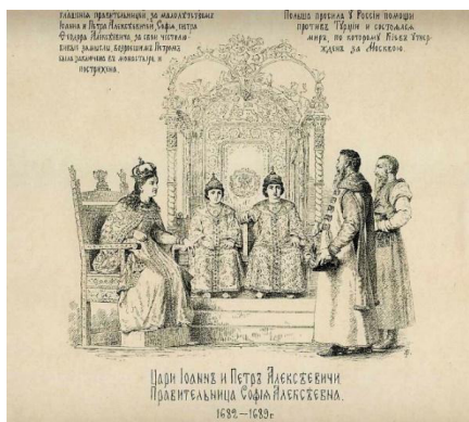
Рис. 2. В.В. Верещагин. «Цари Иоанн и Пётр Алексеевичи. Правительница Софья Алексеевна». 1891 г. [Там же]

Важно упомянуть про живопись, которая отражает в себе события, связанные с приходом Петра I к власти. Здесь необходимо рассмотреть гравюру Василия Верещагина «Цари Иоанн и Пётр Алексеевичи. Правительница Софья Алексеевна» (см. рис. 2), датированную XIX в. и в сравнении с ней привести картину французского живописца Карла Штейбена «Пётр Великий, спасаемый матерью от ярости стрельцов» (см. рис. 3). Данные живописные изображения олицетворяют обстоятельства, в которых юный наследник, растерянный от происходящей жестокой борьбы за власть, но не теряющий самообладания и уверенности, готов стать тем сильным правителем, который преобразит Россию и придаст ей статус великой державы [1].