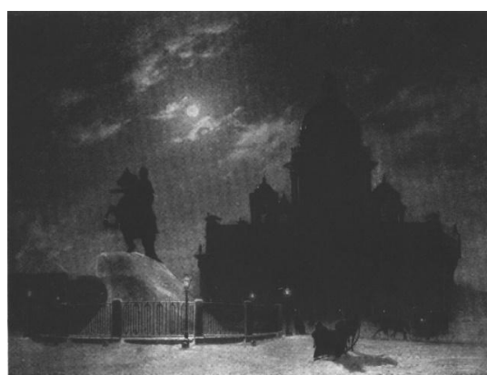
Рис. 12. В.И. Суриков. «Вид памятника Петру I на Исаакиевской площади в Петербурге» 1870 г. [Там же]