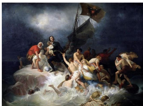
Рис. 11. П. Шамшин. «Пётр Великий спасает утопающих на Лахте». 1844 г. [Там же]

Интерес проявили и такие художники, как П. Шамшин («Пётр Великий спасает утопающих на Лахте», 1844 г.) (см. рис. 11), В.И. Суриков («Вид памятника Петру I на Исаакиевской площади в Петербурге», 1870 г.) (см. рис. 12).