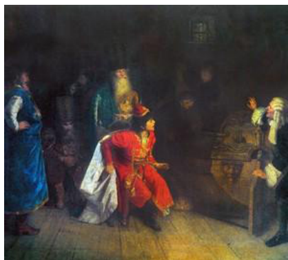
Рис. 10. Г.Г. Мясоедов. «Дедушка русского флота». 1871 г. [1]

В начале 1870-х гг. личность императора привлекла внимание Г.Г. Мясоедова. Этот факт зафиксирован в произведении «Дедушка русского флота» 1871 г. (см. рис. 10).