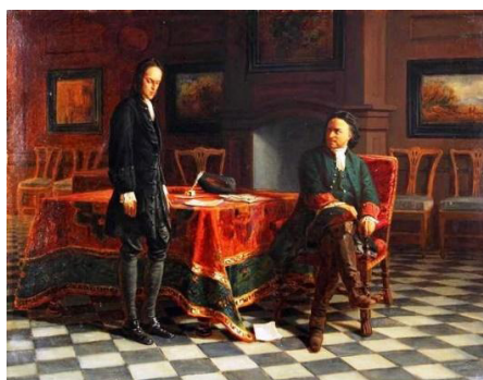
Рис. 5. Николай Ге. «Пётр I допрашивает царевича Алексея Петровича в Петергофе». 1871 г. [Там же]