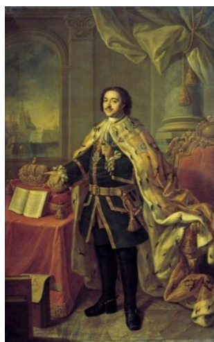
Рис. 4. А. Антропов. «Портрет Петра I». 1770 г. [2]

Важно также сделать акцент на картины, которые заключают в своей живописной идее образ сильного, полновластного правителя, самодержца, временами жестокого, но справедливого. Это произведения Алексея Антропова «Портрет Петра I» 1770 г. (см. рис. 4), Николая Ге «Пётр I допрашивает царевича Алексея Петровича в Петергофе» 1871 г. (см. рис. 5), Александра Бенуа «Размышления Петра Великого об идее строительства Санкт-Петербурга на берегу Балтийского моря» 1916 г. (см. рис. 6), Сергея Кириллова «Пётр I» 1982–1984 гг. (см. рис. 7 на с. 70). Вложенный в эти картины смысл позволяет даже неподготовленному зрителю вообразить себе всю мощь и силу первого российского императора, его властный образ и твердость характера [1].