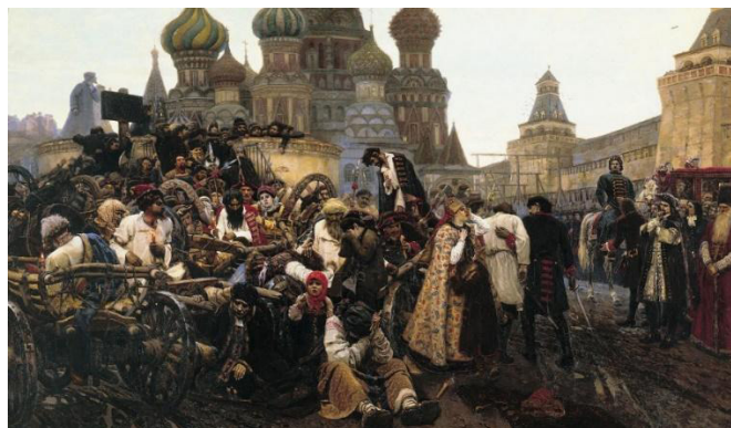
Рис. 13. М.К. Сидоров. «Утро стрелецкой казни». 1881 г. [1]

Многие картины 1872 г. молодой художник выполнил по заказу известного промышленника М.К. Сидорова («Утро стрелецкой казни» 1881 г.) (см. рис. 13) [3, с. 87].