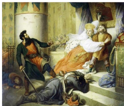
Рис. 3. К. Штейбен. «Пётр Великий, спасаемый матерью от ярости стрельцов». 1830 г. [Там же]