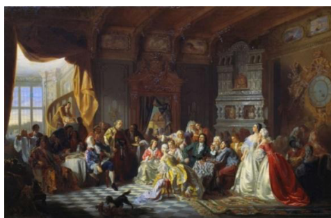
Рис. 9. С. Хлебовский. «Ассамблея при Петре Великом». 1858 г. [Там же]

Эпохой Петра I интересовался Станислав Хлебовский, что нашло отражение в его картине «Ассамблея при Петре Великом» 1858 г. (см. рис. 9).