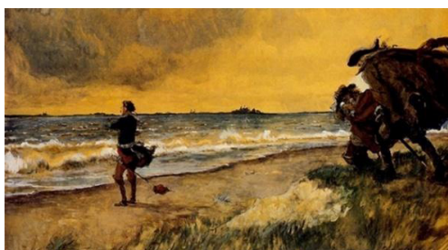
Рис. 6. А. Бенуа. «Размышления Петра Великого об идее строительства Санкт-Петербурга на берегу Балтийского моря». 1916 г. [Там же]