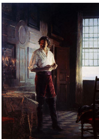
Рис. 7. С. Кириллов. «Пётр I» 1982–1984 гг. [2]

В русском искусстве XIX в. существовали произведения, значение и значимость которых, если рассматривать их как символы и знамения времени, превышали их реальную художественную ценность. К ним относятся, в частности, картина А.Г. Венецианова «Петр Великий. Основание Санкт-Петербурга» (см. рис. 8). Отметим, что у данного автора эта картина является единственным произведением на историческую тему. Не так давно (в 2006 г.) завершилась ее реставрация, значительная видоизменившая ее облик и приведшая некоторых искусствоведов в замешательство. В связи с этим она и получила такую актуальность.