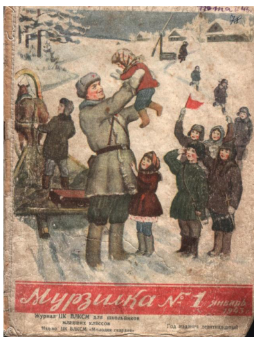
Рис. 4. Обложка «Мурзилки» за январь 1943 г. [3]

Там он приветлив и весел (такой тип изображения начинает фигурировать в выпусках 1943 г. — после коренного перелома в ходе войны). Также публиковались и сводки о героях, где описывался подвиг и рассказывалась биография солдата. Были и упоминания о целых фронтах. Важно, что защитник Отечества — это необязательно мужчина (см. рис. 5). В «Мурзилке» юные читатели узнавали о подвигах летчиц, танкистов, зенитчиц, санитарок и т. д.