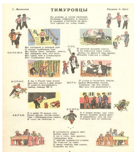
Рис. 8. Тимуровцы [6]

В таких рубриках был сделан акцент на небольшой возраст героя, на его стремление помочь Красной Армии, на проявленные героизм и мужество. Такая информация вдохновляла и маленьких читателей на большие подвиги. Вполне естественно у ребенка возникали вопросы: «А как я могу помочь Родине?», «Каким образом я могу приблизить победу?» (см. рис. 8).