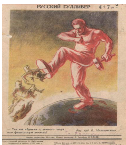
Рис. 6. Русский Гулливер [9]

Именно благодаря таким, как он, на фронте были боеприпасы, военная техника и прочие необходимые вещи для разгрома врага.