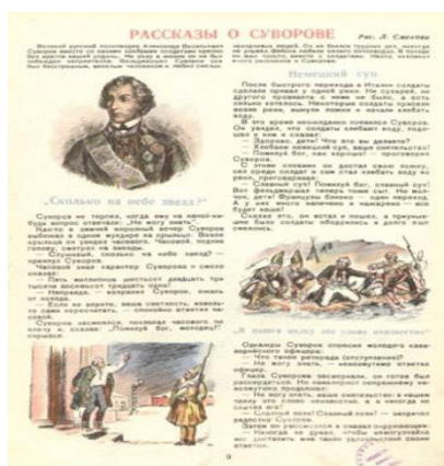
Рис. 2. Рассказы о Суворове [7]

Они – герои из прошлого – были призваны насытить и настоящее подвигами. Использовались не только исторические справки, но и сатирические изображения, которые сопровождались запоминающимися стихотворениями (см. рис. 3).