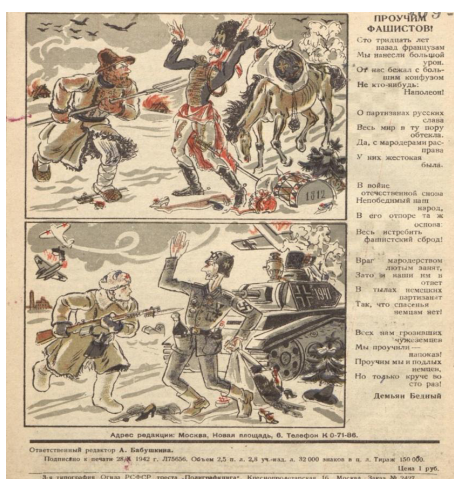
Рис. 3. Проучим фашистов! [8]

Они – герои из прошлого – были призваны насытить и настоящее подвигами. Использовались не только исторические справки, но и сатирические изображения, которые сопровождались запоминающимися стихотворениями (см. рис. 3).