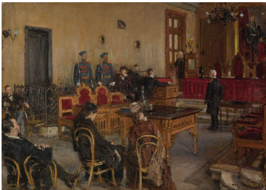
Рис. 7. К.А. Савицкий «В ожидании приговора суда» (1894–1895, ГТГ, Москва)

К.А. Савицкий, художник, прежде всего крестьянской темы, обратился в этом случае к чрезвычайно характерной и важной стороне русской жизни последнего десятилетия XIX в. Картина «В ожидании приговора суда» (1894–1895) (рис. 7) стала косвенным отражением участия русской интеллигенции в политической борьбе.