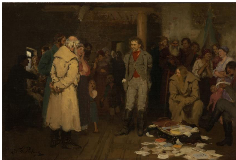
Рис. 3. И.Е. Репин «Арест пропагандиста» (1880–1889, ГТГ, Москва)

Полотно «Арест пропагандиста» (рис. 3) было задумано после того, как ему пришлось стать свидетелем расправы над «народными преступниками». Позже этот суд получил название «Процесс 193-х». Данные события происходили в Петербурге в 1878 г. [3].