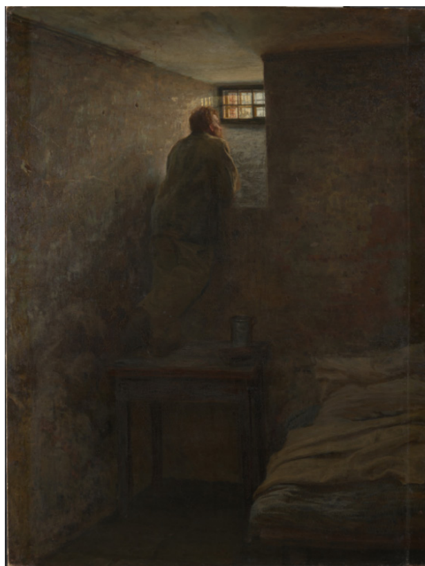
Рис. 1. Н.А. Ярошенко «Заклученный» (1878, ГТГ, Москва)

В своей картине «Заключенный» (1878) (см. рис. 1) Николай Ярошенко пишет запоминающийся тюремный быт. Из пищи заключенного – кружка с водой и Евангелие с крестом на переплете. Художник изображает заключенного со спины, но она столь выразительна, что всем становится ясно, какая жажда не только света, воздуха, но и воли, деятельности, борьбы выражена в этой фигуре.