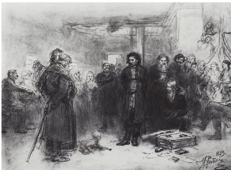
Рис. 2. И.Е. Репин «Арест пропагандиста». Эскиз картины (1879, ГТГ, Москва)

Отметим, что эскиз полотна он сделал через год после окончания судебного процесса над участниками «хождения в народ» (см. рис. 2).