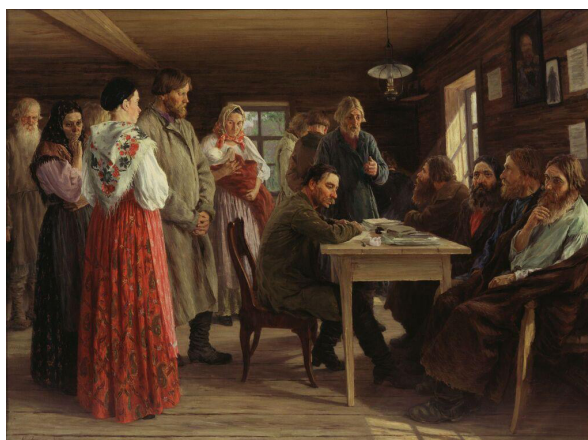
Рис. 5. М.И. Зощенко «Волостной суд» (1888, ГТГ, Москва)

Один из критиков XIX в. так изложил в еженедельном иллюстрированном журнале «Нива» свой взгляд на «доморощенных» судей, которые рассматривают спор крестьян, пришедших в волостной суд для разбирательства в сопровождении свидетелей и своих родственников: «лица всех четверых (судей) крайне типичны. Крайний слева, не полагаясь на себя, старается почерпнуть мудрость из расспросов свидетеля. За ним следует грозный судья; третий выглядит довольно равнодушно к каждому; а последний, наиболее разумный из всех, явно хочет вникнуть в дело, исследуя психологическую сторону каждого из крестьян по выражению их лиц. За столом сидит волостной писарь – эта неизбежная язва наших дней» [4, с. 65].