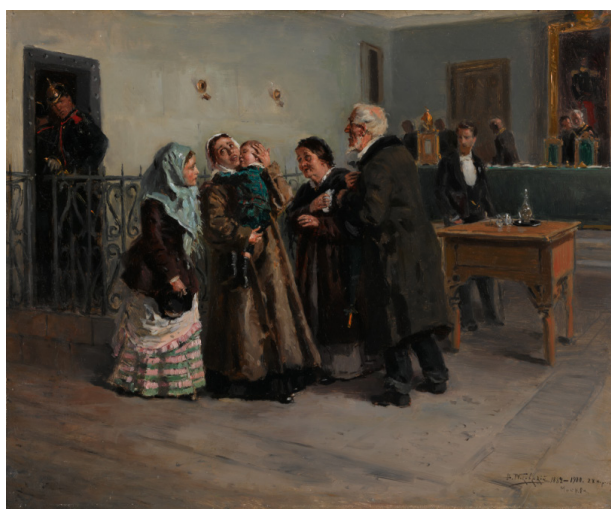
Рис. 6. В.Е. Маковский «Оправданная» (1882–1900, ГТГ, Москва)

В Третьяковской галерее хранятся два варианта картины Владимира Маковского «Оправданная» (1882–1900) (см. рис. 6), которая посвящена решениям суда в данный период.