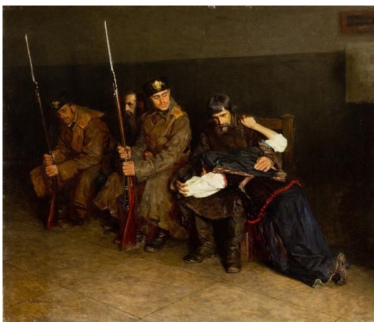
Рис. 8. Н.А. Касаткин «В коридоре окружного суда» (1897, Севастопольский художественный музей им. М.П. Крошицкого, Севастополь)

В севастопольском художественном музее хранится одна из самых известных в дореволюционные годы работ Н.А. Касаткина «В коридоре окружного суда» (1897) (рис. 8).