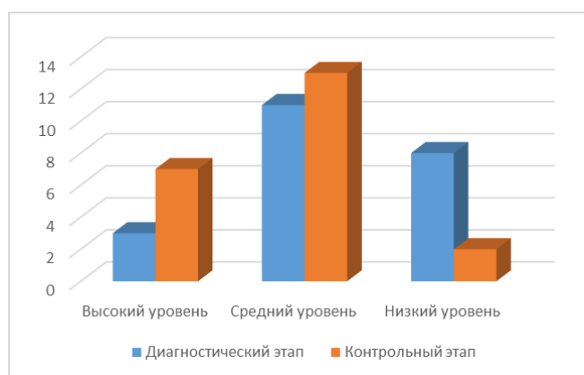
Рис. 1. Динамика развития речи

Результатом нашей ежедневной и целенаправленной работы стала положительная динамика уровня развития речи (см. рис. 1).