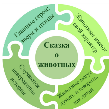
Рис. 2. Жанровая модель сказки о животных

С позиции формирования компонентов читательской грамотности на данном уроке ведется работа по совершенствованию: умения ориентироваться в содержании текста, находить информацию по