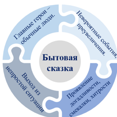
Рис. 3. Жанровая модель бытовой сказки

Аналогичная работа была проведена нами и в ходе изучения волшебных сказок. Всего по работе с жанром и его видами мы провели 6 уроков во 2-м классе (для 26 обучающихся). Динамика результатов обучающихся представлена на диаграмме (см. рис. 4).